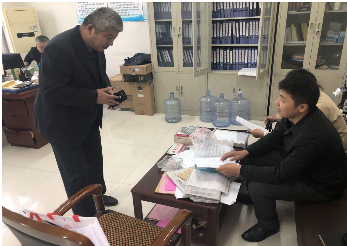
于鄆城县残疾人康复中心座谈及资料收集